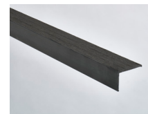
Negro - 165