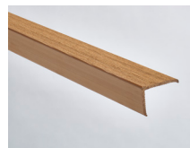
Canela - 163