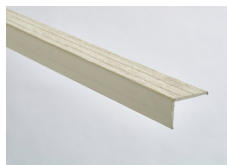
Cemento - 164